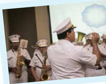
Banda Republicana de Panamá