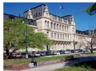
Ministerio de Educación y Deportes de la Nación Palacio Pizzurno