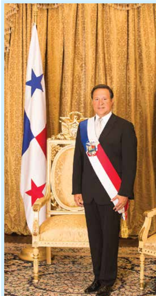
Juan Carlos Varela

En nombre del gobierno y del pueblo de Panamá, reciban nuestros mejores votos de felicidad por la fiesta de su independencia y le extendiendo un cordial abrazo a la comunidad argentina residente en Panamá, quienes desde hace muchos años contribuyen con su esfuerzo al desarrollo de nuestra patria.