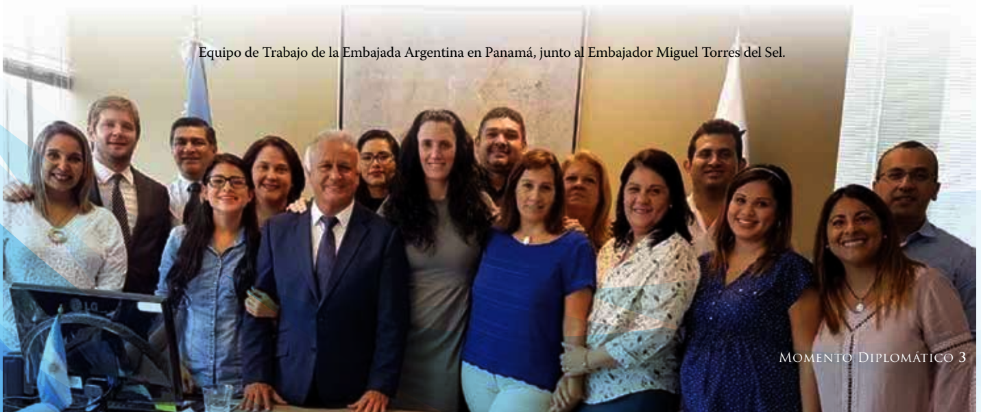
Equipo de Trabajo de la Embajada Argentina en Panamá, junto al Embajador Miguel Torres del Sel.

Avancemos decididos hacia un futuro prometedor y de esperanza, y honremos de esa manera el legado de nuestros próceres. Una vez más: viva la Patria!!!